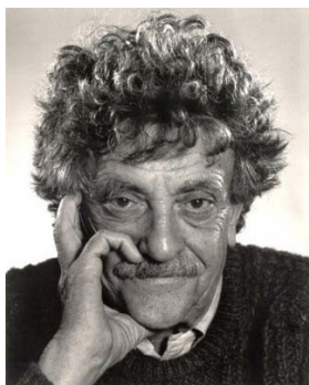
Rys. 5: Kurt Vonnegut.

Strategia osiągania celów Vonneguta pochodzi od znanego, genialnego powieściopisarza — Kurta Vonneguta. Odzwierciedla ona sposób, w jaki Vonnegut pisał swoje książki, tworząc fabułę i rozwijając wątki od tyłu.