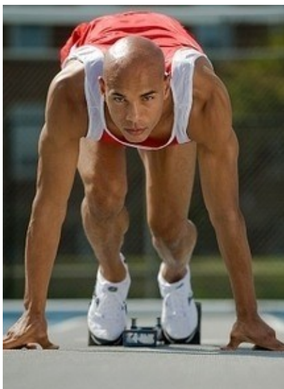
Rys. 8: Koncentracja na celu.

Kluczową umiejętnością prowadzącą do osiągnięcia celu jest umiejętność koncentracji na nim. Wszyscy ludzie sukcesu nauczyli się koncentrować się na jednej rzeczy i trwać przy niej tak długo, aż zostanie zrobiona. Skupienie to zdawanie sobie sprawy z tego, czego się chce. Koncentracja to dyscyplina i siła woli, która pozwala Ci poruszać się w obranym kierunku, aż do końca.