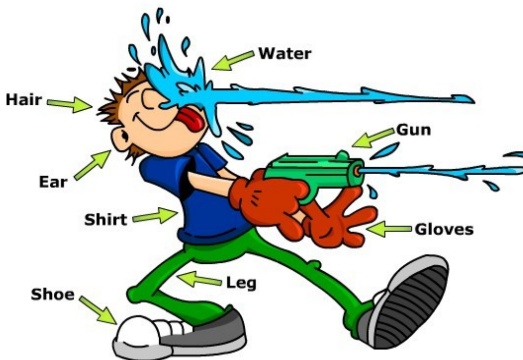
Ilustracja 1: Źródło: opracowanie własne na podstawie materiałów p. Krzysztofa Klimaja – twórcy serwisu www.szybkanauka.fr.pl .

Zgodnie ze starym przysłowiem: jeden rysunek wart jest tysiąca słów, więc najlepszym opisem metody skojarzeń swobodnych będzie poniższy rysunek: