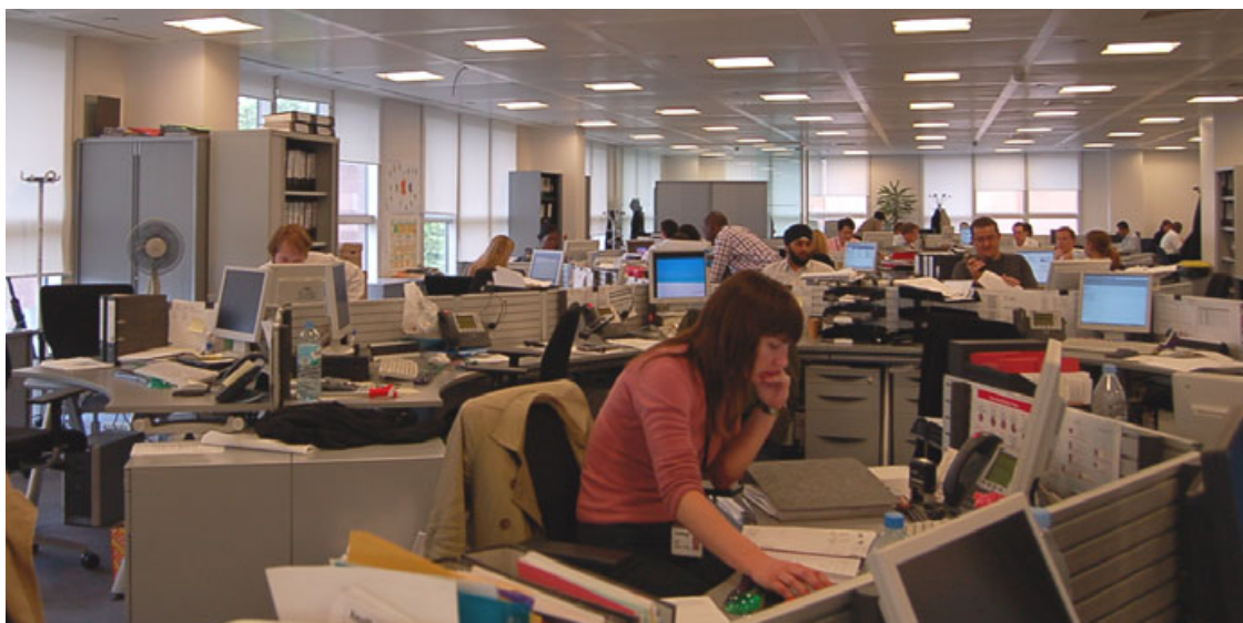
Dzień w biurze Bulldog Broadband przy Red Lion Square, Londyn, 2006-2007