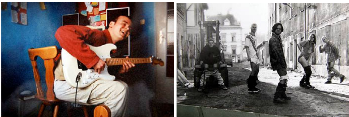
Po lewej: Nagrywanie z zespołem Gayery, Gdańsk, 1998