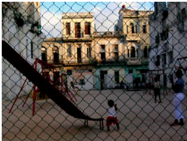
Na Kubie, Hawana, 2006

Zainspirowany karnawalem, jakiś czas później postanowiłem urządzić sobie samotne dwutygodniowe wakacje na Kubie. To był kolejny kamień milowy na ścieżce, którą szedłem, nim odważyłem się zostać podróżnikiem. Moje wakacje okazały się być pobudzającą mieszanką wędrówek z plecakiem, randek z tamtejszymi dziewczynami, nauki salsy, picia słynnego lokalnego rumu i palenia kubańskich cygar. Poznałem innych podróżników i imprezowałem z nimi, korzystając z życia. Niełatwo było mi opuścić cudowne, tropikalne ciepło i energię tego kraju, ale intuicja podpowiadała mi, że kiedyś tam wrócę.